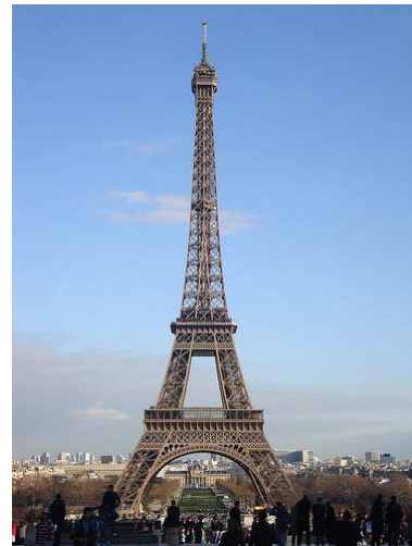
B. Torre Eiffel.