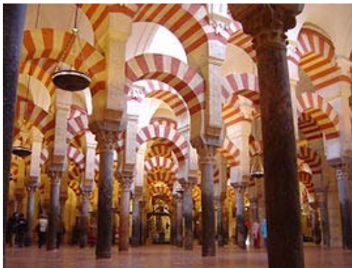
C. Mezquita de Córdoba, arte islámico.