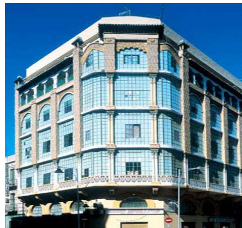
D. Arquitectura modernista