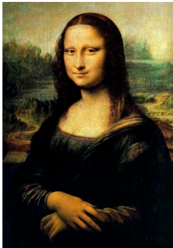
A. Gioconda, pintura renacentista