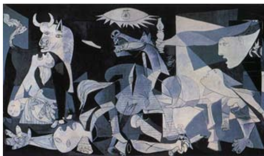
Guernica, Pablo Picasso, 1937

A) Comenta la imagen y desarrolla el tema: La Guerra Civil Española (1936-1939).